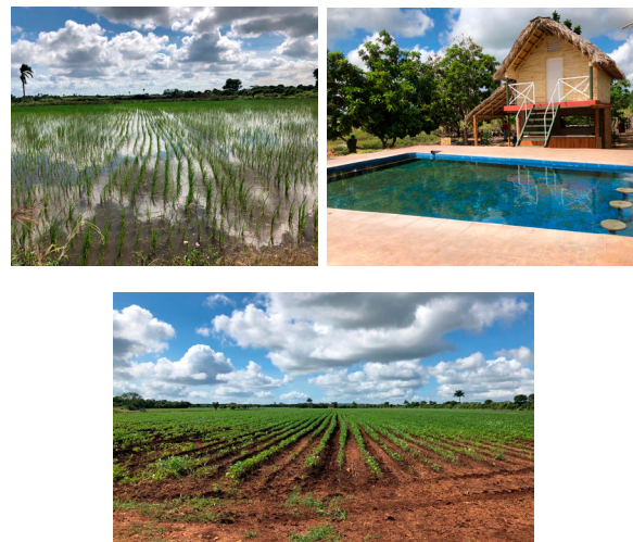
Figura 3. Fotos de la finca La Esperanza