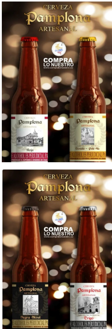
Figura 3. Portafolio de productos