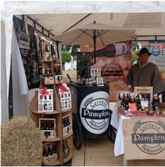
Figura 6. Visual Merchandising