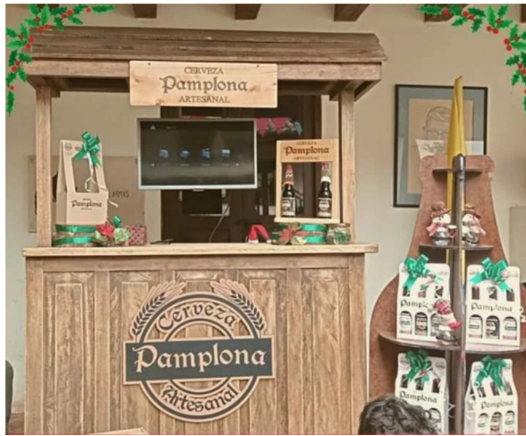
Figura 4. Marketing en ferias empresariales