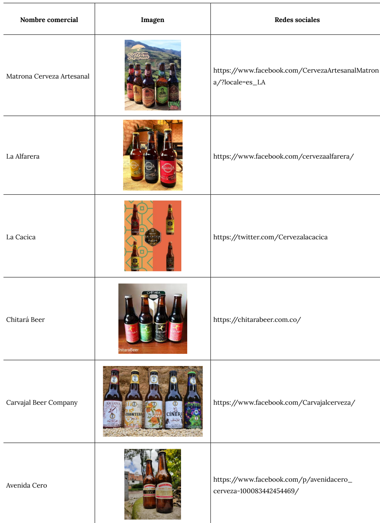
Tabla 1. Cervezas artesanales locales y regionales