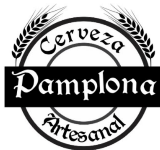
Figura 2. Logotipo de la marca Cerveza Pamplona Artesanal