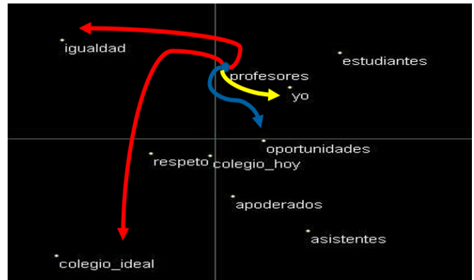
Figura 4. EMD 2D profesores

En la figura 4, es posible observar el EMD del grupo de los Profesores . Al igual que en la figura 3, las flechas señalan que tan cercanos se encuentra el Yo del grupo, y cuál es el rótulo más cercano y el más lejano para cada grupo.