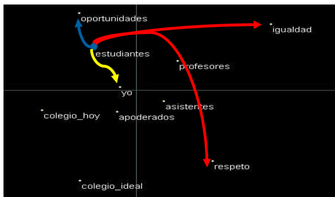
Figura 5. EMD 2D estudiantes

En la figura 5, es posible observar el EMD del grupo de los Estudiantes , las flechas señalan qué tan cercanos se encuentra el Yo del grupo, y cuál es el rótulo más cercano y el más lejano para cada grupo.