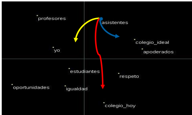
Figura 3. EMD 2D asistentes de la educación

En la figura 3, es posible observar el EMD del grupo de los Asistentes , como en la figura 1, las flechas señalan qué tan cercanos se encuentra el Yo del grupo, y cuál es el rótulo más cercano y el más lejano para cada grupo.