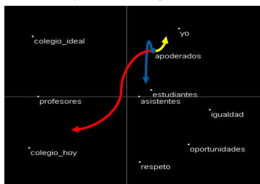
Figura 2. EMD 2D apoderados

Para complementar los análisis de los resultados, se elaboró la figura 2, donde es posible observar el EMD del grupo de Apoderados , las flechas señalan que tan cercanos se encuentra el Yo del grupo y cuál es la rotulo más cercano, y más lejano para cada grupo.